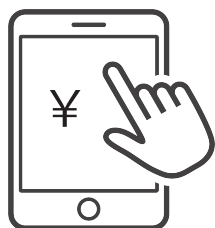
施設様端末にて計上